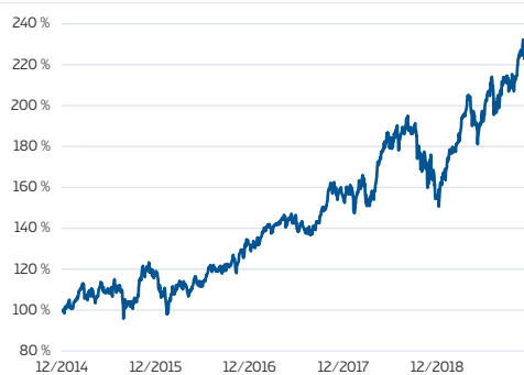
Korrigált nettó eszközértékek (bázis 100) 30.12.2014 és 30.12.2019 között